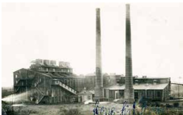
Grube Concordia Süd, Liblar

Die Ursprünge des Kohleabbaus als Brennstoff („Cöllnische Erde / Umbererde“) reicht im Stadtgebiet zurück bis ins 17. Jahrhundert. Im Rahmen einer ca. zweistündigen Exkursion werden den Teilnehmern in der näheren Umgebung von Liblar die ehemaligen Standorte der Braunkohlegruben „Concordia Süd“, Grube Liblar und Grube Donatus“ sowie der Bergarbeiterkolonie Bergmannsruh näher erläutert. Die Führung endet im Garten des Verwaltungsgebäudes der Grube Liblar (heute „Waldbiergarten“, Grubenweg 8). Die Führung richtet sich an alle, die mehr über Ihre Heimat und ihren Wohnort erfahren möchten.