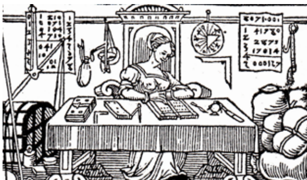
Kauffrau in der Schreibkammer

Städten den höchsten und qualifiziertesten Anteil am städtischen Wirtschaftsleben hatten und es sogar zur Bildung eigener Frauenzünfte kam.