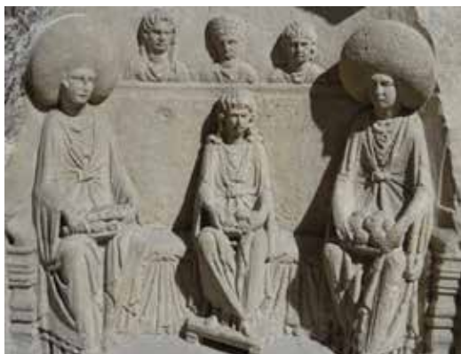
Matronenaltar LVR Museum Bonn

Im 2. und 3. Jahrhundert n. Chr. beherrscht der Kult der verschiedenen Matronae die religiösen Äußerungen der Bevölkerung zwischen Rhein und Eifel. Matronae sind einheimische (wohl germanische) Göttinnen, die in Dreizahl verehrt und mit verschiedenen einheimischen Namen bezeichnet wurden (im Gebiet von Erftstadt: Fachinehae, Lanehia, Vanginehae). Nur wenige Heiligtümer dieser Göttinnen sind ausgegraben worden und die antike Literatur berichtet nichts von ihnen, weshalb wir uns für die Erklärung, in welchen Nöten sich die Einheimischen an sie wendeten, an die Interpretation der