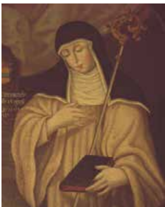
Zisterzienseräbtissin, Kloster Seligenthal

Ziel war die Erneuerung christlicher Werte und Lebensführung unter der Ordensregel „Ora et labora“ (Bete und Arbeite). Diese Reform führte u.a. zu einer religiösen Frauenbewegung,