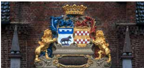
Schloss Gracht, Allianz-Wappen der Fam. Wolff Metternich von 1698