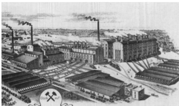
Briekopf Brikettfabrik Donatus

Neben der Entwicklung der Abbautechnik kommen Themen wie Verarbeitung, Wasserhaltung und Bergschäden zur Sprache.