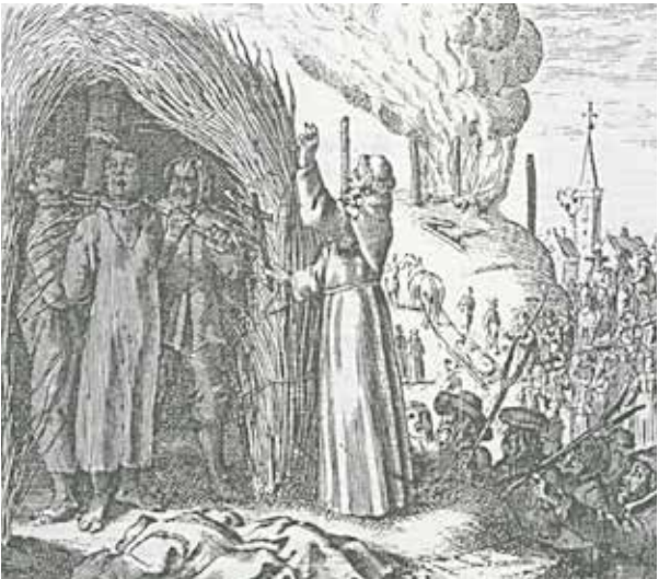
Hexenverbrennung aus Hermann Löher, Wemütige Klage der frommen Unschültigen 1676

Der Vortrag gibt Antwort auf häufig gestellte Fragen: Was waren die Rahmenbedingungen der Hexenverfolgungen und wann begannen sie? Welchen Stellenwert besaß der Hexenglaube in der Frühen Neuzeit? Welche Inhalte umfasste er? Wer waren die Träger der Verfolgungen? Welche Rolle spielten die Kirchen? Wer waren die Angeklagten und wie gerieten sie in den Fokus der Verfolgung?