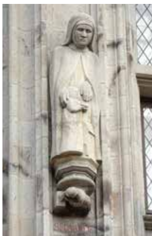
Figur der Sela Jude am Kölner Rathaus

Frauengeschichte geht jede und jeden etwas an! Der Vortrag soll einen persönlichen Zugang zur Geschichte der Frauen im Rheinland vermitteln und zeigen, wie Frauen früher gelebt, geliebt und gearbeitet haben. Es ist uns wichtig, die Vergangenheit der Rheinländerinnen erlebbar zu machen und mit der Gegenwart in Bezug zu setzen.